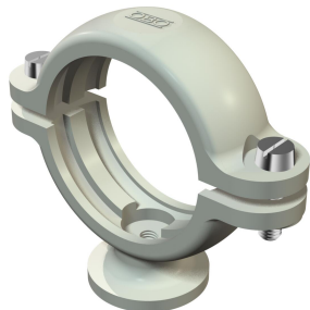
Grapa de zócalo ISO 36,5-40mm