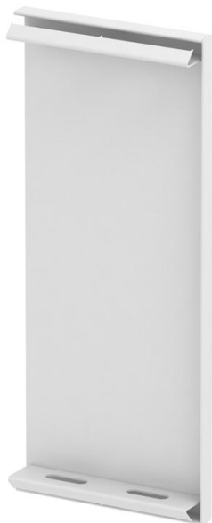
Tapa final para canal portamecanismos GS.